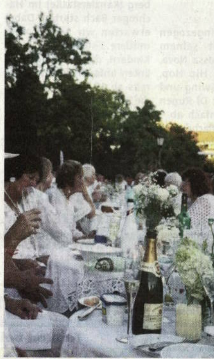
Ob edles Dinner in Weiß oder kunterbuntes Straßenfest, in Unterhaching ist am Samstag, 28. und Sonntag, 29. Juli, wieder jede Menge geboten. Bei beiden gilt: Eintritt frei.

UNTERHACHING · Das letzte Juli-Wochenende hat es in Unterhaching in sich! Wer möchte, kann praktisch von Samstag, 28. Juli, 19 Uhr bis Sonntag, 29. Juli, 20 Uhr durchfeiern. Nur zum Schlafen müsste man sich zwischen den beiden Großveranstaltungen ein Plätzchen suchen. Den Anfang macht das mittlerweile 2. Dinner in Weiß. Organisator ist der Städtepartnerschaftskreis Unterhaching. Ein Teil der Mitglieder hatte an einem solchen »Dîner en Blanc« schon häufiger in Le Vesinet, der französischen Partnerstadt von Unterhaching teilgenommen. »Diese Dinner in Weiß sind immer Höhepunkte unserer Besuche in Le Vesinet«, betonten die Organisatoren des Unterhachinger Ablegers. In Frankreich, so verriet die begeisterten Anhänger dieses Festes, sind aber nicht einfach nur die Tische weiß eingedeckt und die Teilnehmer weiß gekleidet, sondern alle geben sich besonders viel Mühe mit der Gestaltung ihres Tisches, haben Hussen für ihre Stühle dabei, Kerzenleuchter und Blumenschmuck, um aus dem improvisierten Fest eine glanzvolle Veranstaltung zu machen. »Da man sich für die Veranstaltung nicht anmelden muss, waren wir natürlich sehr gespannt, wie viele Bürger unserer Einladung folgen würden«, bekannte Astrid